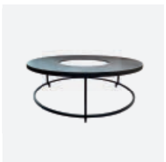
Plate Extension Set XL