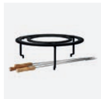
Brazilian Grill Set XL