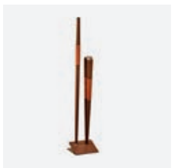
Buffadoo Set Brown