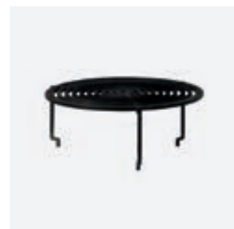
Grill Round XL