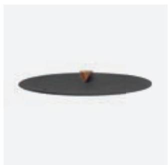
Snuffer Black XL